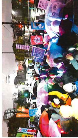
しんぶん赤旗 3/26より転載