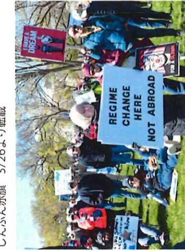
しんぶん赤旗 3/30より転載