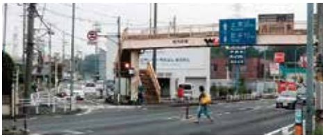
横断歩道は住民の長年の願い

「呼塚歩道橋下に横断歩道の設置を」という請願が住民の皆さんから出されました。高齢化が進み、一方で