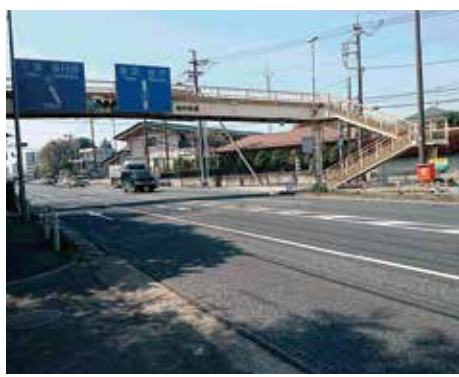
呼塚歩道橋のある交差点

「呼塚歩道橋下に横断歩道を」の請願が採択されました。請願は昨年の9月議会に提出されましたが、9月議会、12月議会と「継続審査」とされました。日本共産党は、住民の皆さんの切実な願いであり、