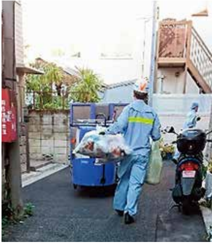
台東区でのごみの戸別収集

Q 柏市がごみの戸別収集事業をスタートさせると聞きました。どんな事業ですか。 A 全国でも近隣市でも、高齢者のごみ出し支援事業を行う自治体が広がっています。柏市も10月から「ごみ出し困難者支援収集事業」がスタートします。2020年度から市区町村の経費の半額を国が負担します。