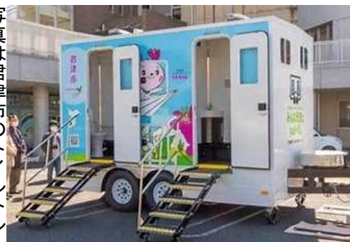
写真は君津市のトイレトレーラー

能登半島地震などの災害現場で有効性が証明された災害対応の「トイレトレーラー」。議会で購入を求めてきました。2台の購入予算4千万円が、今議会の補正予算に計上されました。